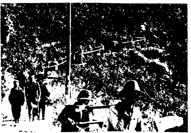
UIT DE CHINEESCHE OORLOGSHEL ONTSNAPT Hierbij een kiekje van de karavaan blanken waaronder 15 missionnarissen die door de bemanning van de Amerikaansche kanonneerboot «Monococy» ten koste van de grootste inspanningen uit de oorlogshel in China werd gered