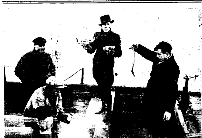
DE DOOD OVER DE VAART VAN BRUGGE NAAR ZEEBRUGGE De waters van de vaart Brugge—Zeebrugge bieden voor het oog een treurig schouwspel. Al de levende dieren die het bevat, zoals groote en kleine palingen, mosselen, krabben en allerhande andere zoutwaterwieren, strijden eiken dag wat meer tegen den dood. Verleden zomer konden de mosselen reeds een doodelijke besmetting door een microob en thans, dat er hoop bestond dat de besmetting geheel zou verdwijnen, is, door het feit dat een groote hoeveelheid creosoot in de vaart gestort werd, een veel erger gevaar gerezen. De foto toont hoe enkele visschers op het grondgebied van Lissewege, waar de besmetting het ergst is, enkele groote krabben en groote palingen, die tegen den dood spartelen, uit het water hebben verwijderd. Ongelukkig bieden deze dieren, die in andere omstandigheden zoo lekker bereid worden, thans het grootste gevaar.