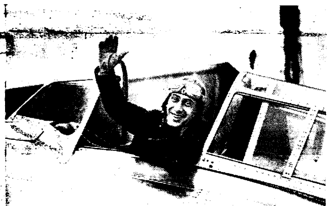
HET VLEGREKORD OP DE LIJN PARIJS—BRUSSEL Hierbij een foto van de Amerikaansche vlieger Alexander Seversky, die, zoals wij gisteren meldden, den afstand Parijs—Brussel aflegde in den rekordtijd van 33 minuten