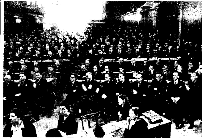
Een blik in de kongressaal.

Zondag is het derde kongres van de B. W. P. binnen de twee maanden gehouden. Telkens was dezelfde kwestie het hoofdpunt van de debatten: de Spaansche aangelegenheden, meer in het bijzonder de kwestie van Burgos.