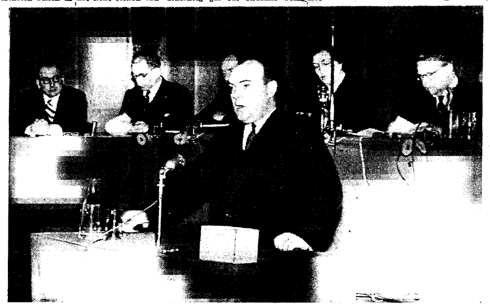
Het bureau van de kongres tijdens de rede van P. H. Spaak (op het voorplan).

Het slachtoffer is naderhand aan zijn verwondingen bezweken.