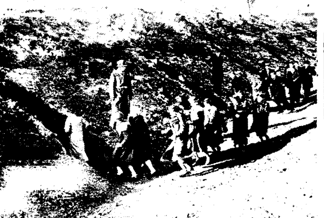
EEN PRIVATE «MAGINOT-LIJN» TE LONDEN

De bekende Engelse fabrikant «Firestone» te Londen heeft een private «Maginot-lijn» gekonstrueerd, bestaande uit betonnen schuilplaatsen die de duizend leden van het personeel bij een gebeurtenis lichte aanvallen dekking kunnen verschaffen.