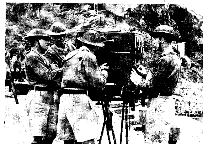
DE ENGELSCH VOORZORGEN IN HET VERRE OOSTEN De Engelschen nemen doeltreffende voorzorgen om Hongkong, hun handelsbasis in het Verre Oosten, tegen de Japansche pretenties te verdedigen. Hierbij een kiekje van een vliegtuigdetektor, die er in dienst van de luchtafweerdiensten is gesteld.

Vrijdagmorgen hield de Volkenbondsraad zijn laatste zitting. De Raad keurde de resoluties betreffende Spanje en China goed, evenals het rapport van de Britsche onderzoekskommissie inzake de bombardementen der rebellen in Republiek Spanje. In dit rapport wordt uitdrukkelijk verklaard, dat talrijke der bombardementen opzettelijk de burgerbevolking beoogden. Zulks wordt opnieuw door den Raad gelaakt. Wat China betreft, de Raad houdt zich bij zijn vroegere beslissing en verzekert China van zijn moreelen steun. Tenslotte werden alle leden van den Volkenbond aangepoord hun hulp-actie voor Spanje uit te breiden.