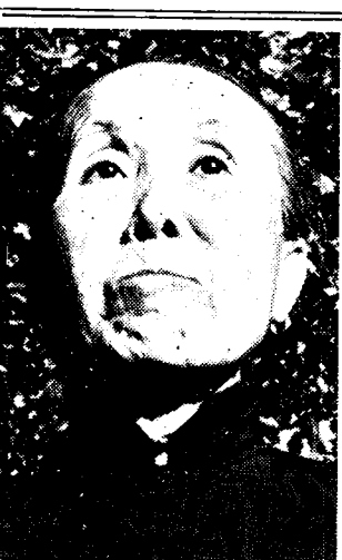
DE MOEDER VAN DE GUERRILLA IN CHINA

Het gruwelijk optreden der Italianen tegenover vrouwen en kinderen