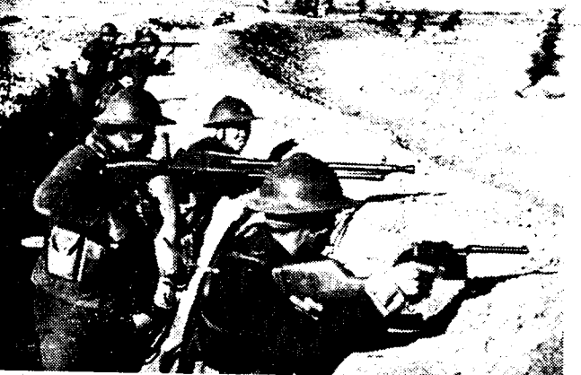
DE OORLOG IN CHINA Een kiekje van goed uitgeruste Chinese soldaten in gevechtstelling. Op het achterplan bemerkt men een andere afdeling, die een stormloop onderneemt tegen de Japansche linies.