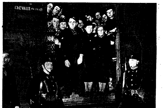
OEFENINGEN VAN PASSIEVE VERDEDIGING TE PARIJS Te Parijs werden zeer uitgebreide oefeningen van passieve verdediging gehouden. Er werden o.m. proeven genomen tot het ontruimen der stad door de burgerlijke bevolking. Hierbij heeft men, zooals men zien kan, beroep gedaan op de beestevuurs van het spoorwegaan.

Het is van oordeel dat er voor de regering geen aanleiding bestaat ontslag te nemen alvorens het parlement voor zijn verantwoordelijkheid werd gesteld.»