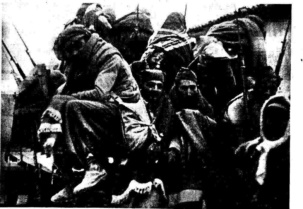
Spaansche boeren, die zich als vrijwilligers lieten talfoeren, op weg naar het Extremadura-front.

Van een roofmoord kan er geen sprake zijn vermits het slachtoffer weinig of geen geld bezat. Een afrekening is eveneens uitgesloten, daar Juguet geen bekende was van de Parijsche onderwereld. Tenslotte wordt, nog geagend van de daad van een sadist. Het verdere onderzoek zal dit punt misschien nader ophelderen?