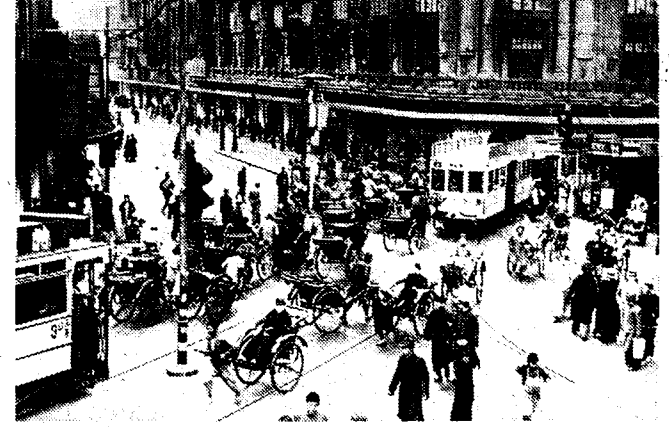
Het schijnt wel dat het vroeger zeer drukke levendje stilaan herneemt in Shanghai, niettegenstaande de oorlogsmisfeiten.

DE CHINEESCHE REGERING EN DE KOMMUNISTEN De Chinese kommunistische leiders en hun volgelingen ontkenen zich, volgens een bericht van Dornel, van het aannemen van verantwoordelijke posten in de Kwomintangregering. Dat zou geschieden op advies