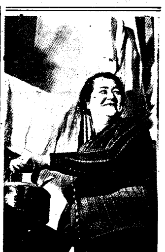
MEVR. HITLER de schoonzuster van den nazi-diktator, en die, zooals we gemeld hebben, in Ierland terecht stond wegens het niet betalen van haar huurgeld.