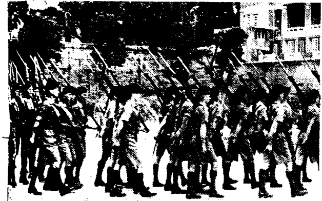
DE BRITSCHE BELANGEN IN HET VERRE OOSTEN BEDREIGD Schotsche troepen zijn te Hongkong ontscheept om er het garnizoen te versterken met het oog op de stijgende bedreiging van den kant van Japan