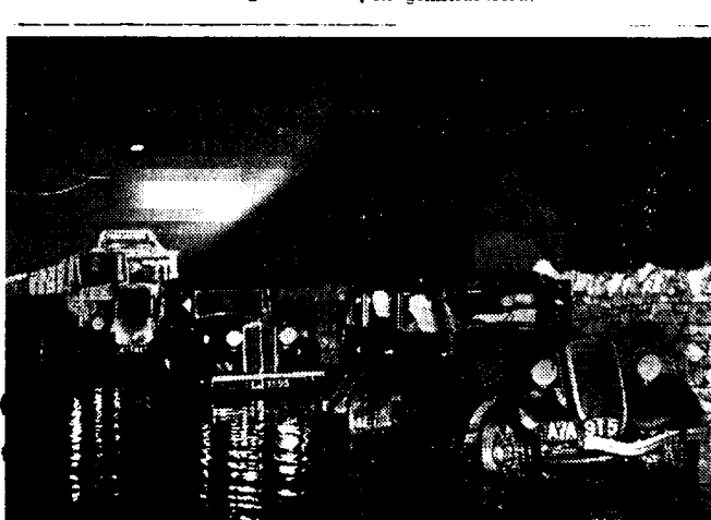
OVERSTROMINGEN IN ENGELAND! In de omgeving van de stad Portland staan de verkeerswegen tengevolge van den overvloedigen regenval blank. Teneinde ongevallen te voorkomen, geschiedt het verkeer van rijtuigen en auto's op 's avonds onder de belichting van krachtige schijnwerpers.

De Engelsche «hemelen» zullen op Amerikaanschen leest geschied zijn. Er werden reeds vee tig personen ingeschreven; zij zullen het voordeel genieten van te mogen spreken met den «apostel» van «God de Vader», zij zullen voordrachten en feestmalen bijwonen en er zal 's nachts gezongen en gedanst worden!