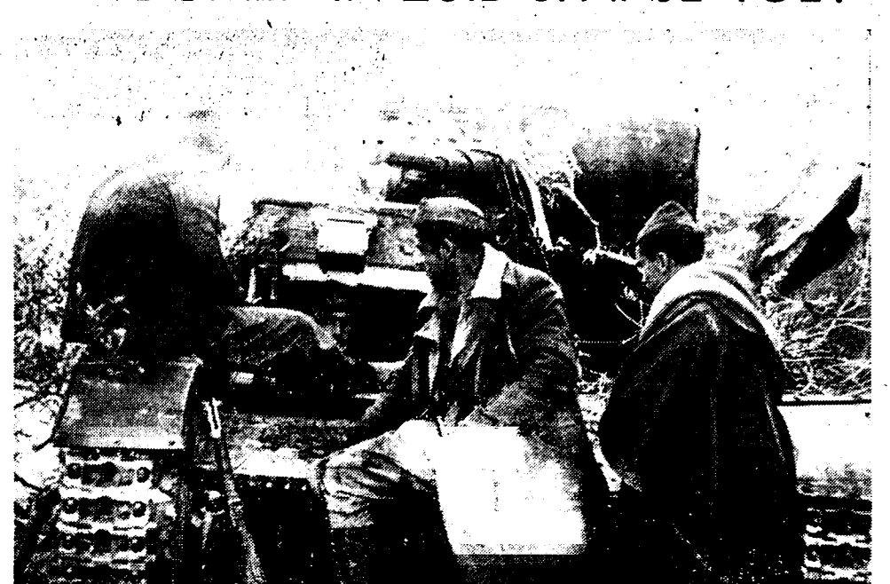
Een republikeinsche tank klaar voor een tegenaanval op het Katalaansche front

NIEUWE ITALIAANSCH TROEPEN STROOMEN IN ZUID-SPANJE TOE!