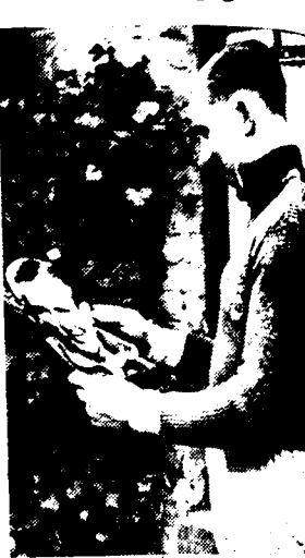
A. Deraet neemt inzag van zijn foto in het weekblad A.B.C.

— Slaats-Pelleners, die terloops gezegd best reden in die jacht en veel beter zelfs dan Buysse-Biliet — die toen overtuigend en vaak meekloeden rijden van den laatste nacht moesten inboeten — waren zoo met mede op leidershoogte gekomen naast de Gentenaars en met een groter puntenaantal in gewonnen positie te liggen. Doch wanneer Pelleners nu onmiddellijk achter Debruycker en Naeye, die zelf Kaers maakten op Olmo, naderhand, terwijl Buysse-Biliet op dit kritische moment uit de baan waren wegens