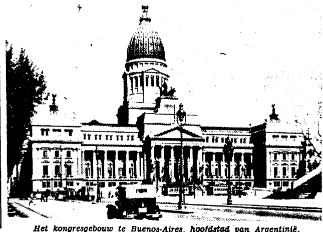
Het kongresgebouw te Buenos-Aires, hoofdstad van Argentinië.

Thans bestudeert men in Ierland en in Schotland de mogelijkheden tot vlasseit. Vooral Schotland schijnt alle voorwaarden te vereenigen om een doelmatige vlasbouw toe te laten. Een groote leemte echter: de opleiding van werkrachten die in de behandeling van de plant en van den vezel moeten gespecialiseerd zijn.