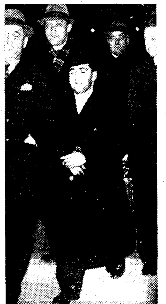
De moordenaar Resiale, die van Bordeaux naar Parijs werd overgebracht, werd in het Austerlitz-station door de menigte fel uitgehouden.

De regering heeft vliegtuigen ter plaatse gezonden.