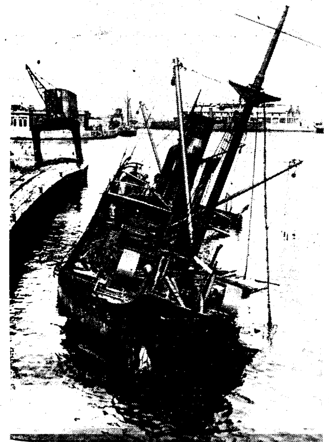
Het Engelsch stoomschip « Pentham » dat in de haven van Valencia door rebelen-vliegers tot zinken werd gebracht.