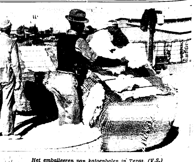
Het emballeeren van katoenbalen in Texas. (V.S.)

Deze vezel zou zeer sterk en veelkrachtig zijn en zou vooral gebruikt kunnen worden voor de fabricatie van breigoedartikelen alsook voor deze van zijde voor borstels, raketkorden, vischlijnen, plastische produkten en doorschijnende omslagen.