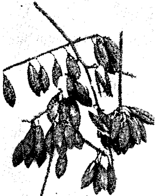
Tak met rijpe kapokvruchten.

In het water kan kapok 25 tot 40 maal zijn eigen gewicht drijven. Hierom wordt de grond-