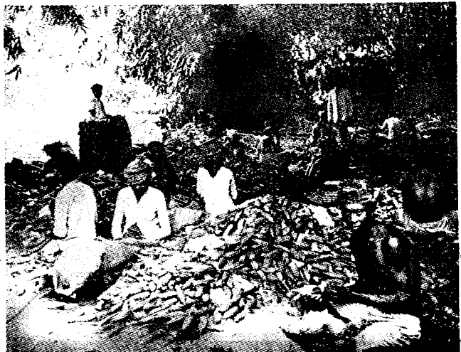
Het verwijderen van de kapok uit de vruchten.

Weefsels uit kapok vervaardigd, zijn dan ook, gezien hun hoge prijzen, een lux-artikel en worden alleen voor decoratieve doeleinden aangewend om hun fraaien glans.