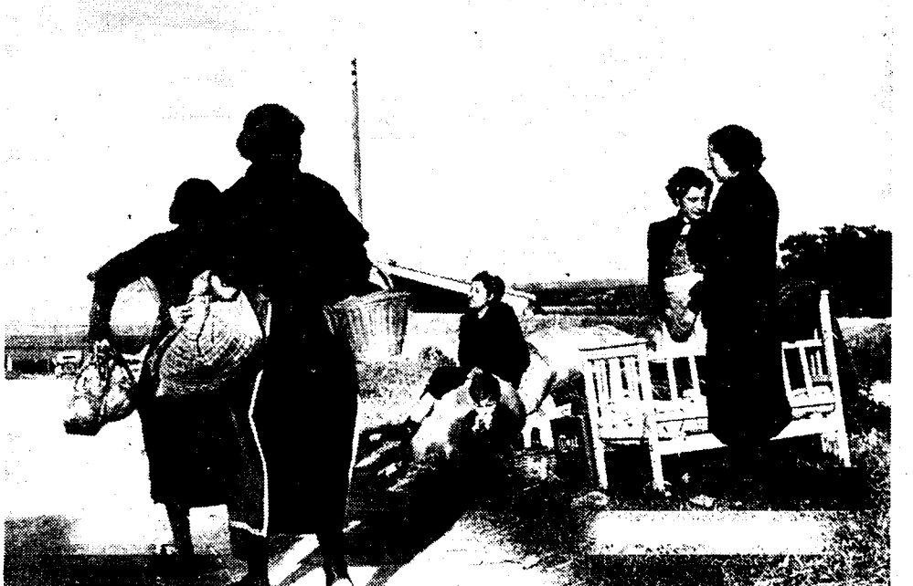
DE VLUCHT UIT BARCELONA Kalm en gelaten trekken vrouwen en kinderen uit de zwaarbeschopte stad. Langs de wegen rusten ze uit en wachten met hun schamel bezit, in de hoop dat een of ander autobestuurder hen zal willen meevoeren, ver weg uit de oorlogsshel.