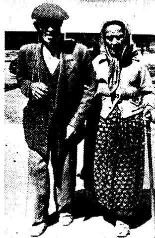
Het oorlogsspuwel heeft zelfs de oude sukkel de baan der miserie en der onbekende toekomst opgejaagd