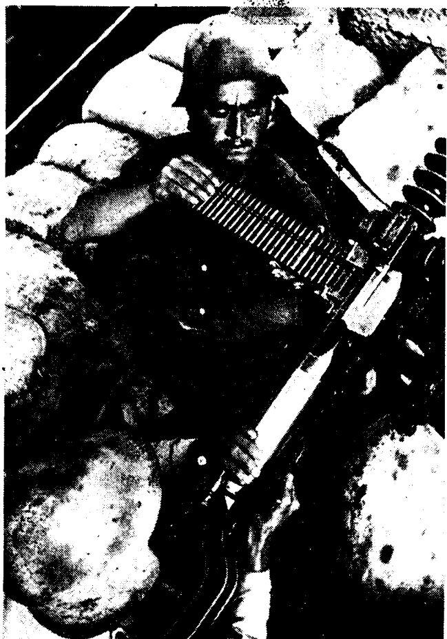
DE STRIJD GAAT VOORT...

Het republikeinsche leger is in Katalonië verslagen doch niet vernietigd. In Noord-Katalonië worden de troepen gereorganiseerd voor den verderen strijd tegen het internationaal fascisme