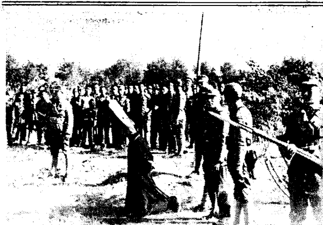
DE OORLOG IN CHINA

De maatregelen die aan de Spaansche grens getroffen werden met het oog op de herberging van de vluchtelingen, werd eveneens besproken.