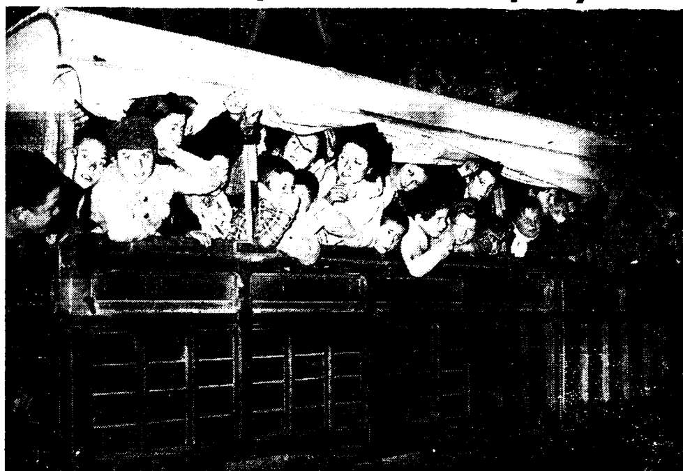
NA DEN VAL VAN BARCELONA. Een autokamion met Spaansche kinderen, gekiekt bij zijn aankomst in het Fransche grensstadje Perthus.