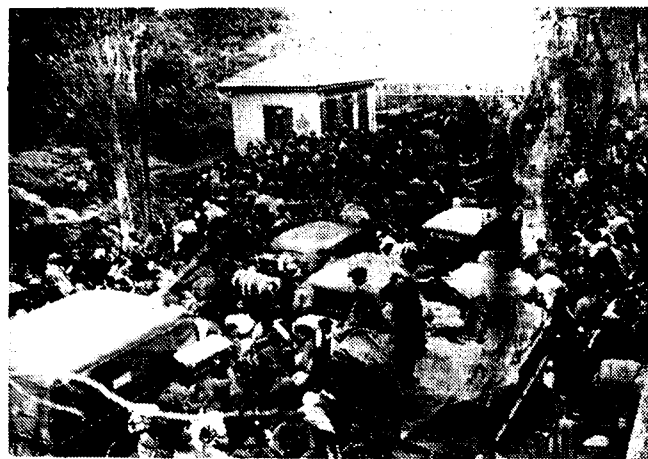
De troosteloze uittocht van de Katalaansche bevolking, op de vlucht voor den fascistischen overvloediger, duurt voort. Hierbij een chaotisch zicht van de menschen en het materiaal op de baan naar de Fransche grens.