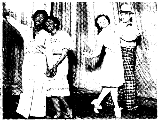
De Lea Daan-groep, gekleed tijdens de dans-schets "Negro Song", die een buitengewoon succes genoot.

Het solidariteitsfeest der socialistische jeugd Gent ten voordeele der Spaansche kinderen