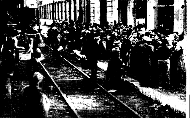
VLUCHTELINGEN UIT MINORCA TE MARSEILLE.

Valencia is op een dag niet minder dan vijf maal gebombardeerd geworden.