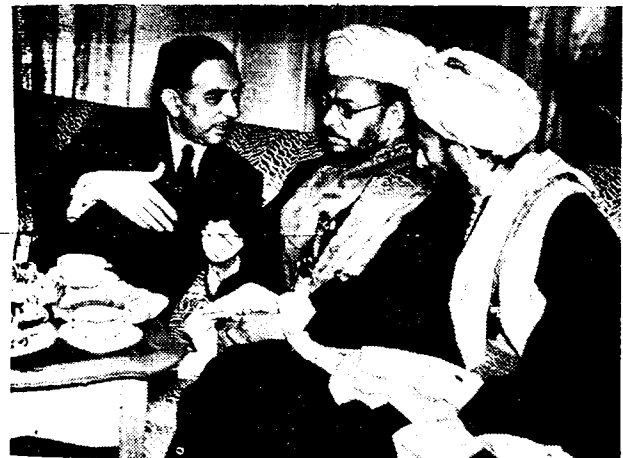
BIJ DE RONDE-TAFELKONFERENTIE TE LONDEN Een kiekje van de tenoren die over den vrede in het nabije Oosten te beslissen hebben. v. l. n. r.: Dr. Nuri Said, eerste-minister van Irak in gesprek met twee afgevaardigden van Yemen