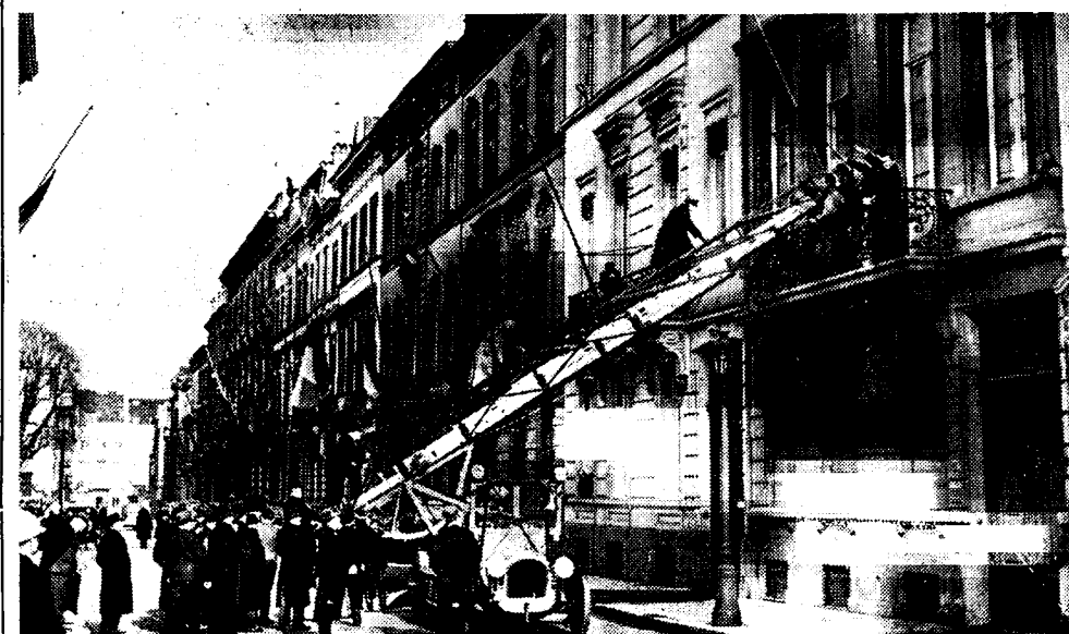
DE OVERVAL VAN DE FASCISTISCHE SPANJAARDS OP DE « CASA DE ESPANA » TE BRUSSEL. Politieagenten moeten zich van de brandweerladder bedienen om de fascistische uitdagers te bereiken die zich op het balkon hadden opgesteld.