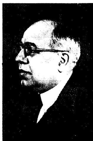
AZANA president der Spaansche republiek.