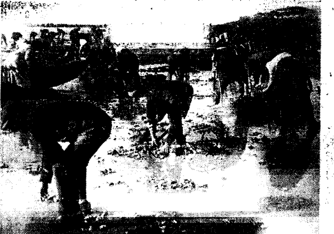
EEN MIRAKULEUZE VANGST

Alhoewel al de bewoners uit de streek aan de werken deelnemen, die ondernomen zijn om de geweldige aardmassa tegen te houden, bleven alle pogingen totnogtoe vruchteloos.