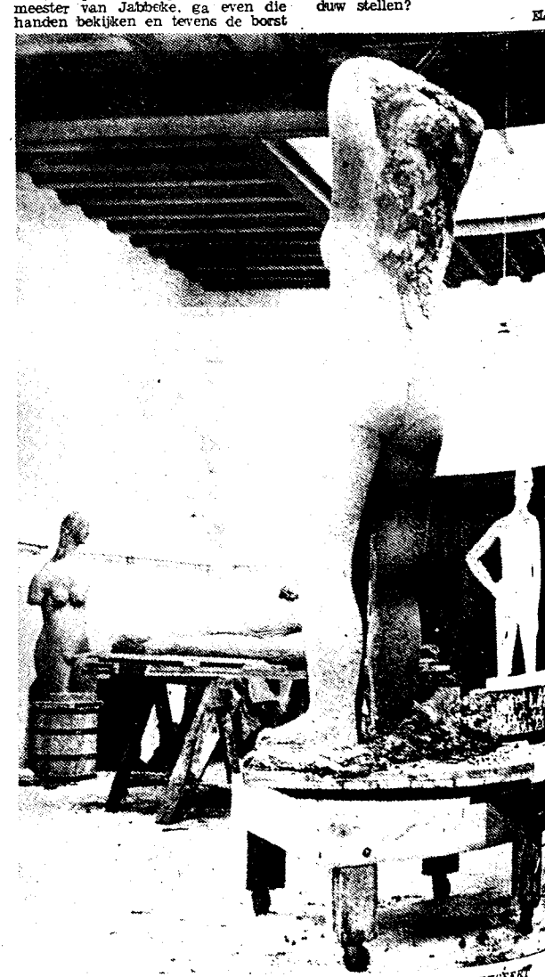
EEN KIJKE IN HET ATELIER, WAAR PERMEKE BOETSEERT

van de Torso met de wespentail. Naast dit alles exposeert Permeke een twintigtal teekeningen, die wijdver in plasticiteit met zijn beelden. Is het den beeldhouwer onrecht aandoen, te verklaren dat sommige zijner teekeningen en voluutering king ver zijn skulptuur in de skulptuur stellen?