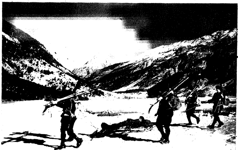
ITAIRE SKI-OEFENINGEN TE BRIANÇON

Te Boekarest had een Roemeense tooneelspeelster, om zich van haar kindje te ontmaken, dit op een stoel gebonden in een kleine kamer, waar een brasero met houtskool stond te branden. Zij hoopte dat het meisje door den rook zou stikken, maar de aandacht van de geburen werd door den rook getrokken en alzoo kon men het kind redden. De ontaarde moeder is aangehouden.