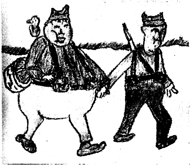
DE GEVANGEN REBEL Spaansche kinderteekening door P. Zaplana, 12 jaar.

Op een leeftijd, dat andere meisjes nog dromen van Blanca Nieves en Caperucita Roja en dat de jongens