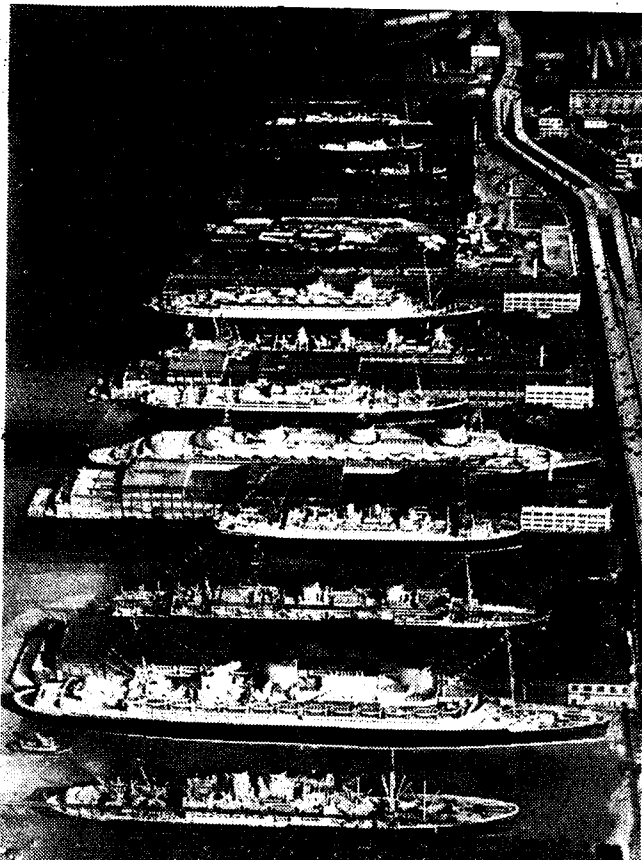
Een merkwaardig luchtzieke van het Hudson-dok te New York, waar talrijke oceanreuzen broederlijk zijde aan zijde liggen gemeerd. Men herkent (van onthaag naar onthaag) de «Hamburg», de «Bremen» en de «Columbus», Duitse booten, de Fransche transatlantiekers «De Grasse» en de «Normandie»; de Engelsche liners «Britannia» en «Aquitania» en de Italiaansche pakketboot «Conte di Savoia».