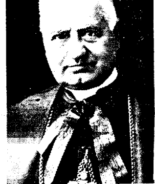
KARDINAAL MAGLIONE die tot staatssekreteris van Pius XII werd benoemd.

Eugenio Pacelli is te Rome geboren op 2 Maart 1876 als zoon van een advocaat bij het Vatikaansch consistorie.