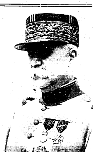
MAARSHALK PÉTAIN die werd aangesteld als Fransche gezant bij de regering van Burgos.