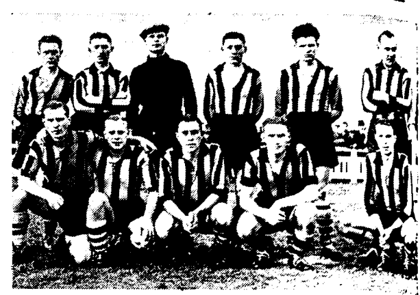
De sterke ploeg van R. C. Doornik, leider van bevordering C, die naar Blankenberge afreist en daar wel de 2 punten zal overnemen.

A. S. Oostende moet het wel met een paar doelpunten verschil halen van Wilryck.