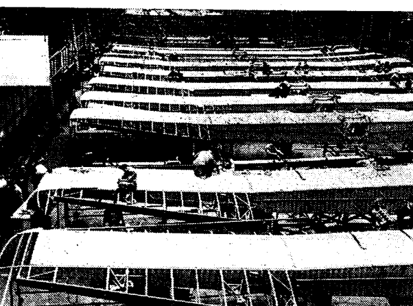
DE Vliegtuigproductie van Engeland en Frankrijk Binnen een half jaar zal de « as » Londen-Parijs in staat zijn 900 vliegtuigen per maand te bouwen. Hoe deze productie tot de spits wordt opgedreven ziet men aan dit kiekje der Armstrong-Whiteworthateliers, waar 28 meter lange vleugels in serie worden vervaardigd. Het zijn helaas geen vleugels voor vredesvliegtuigen, maar voor 8 ton-zware bommenwerpers...