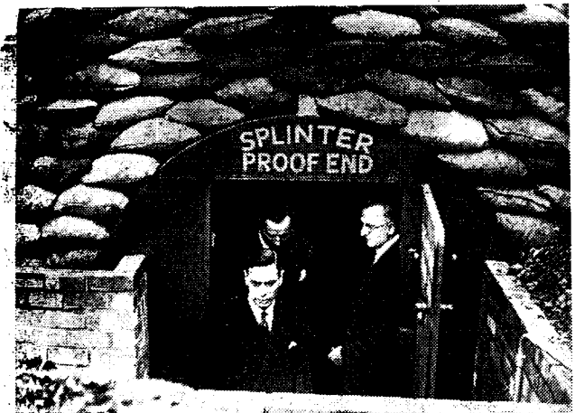
ENGLAND ZORGT VOOR DEGLIJKE LUCHTBESCHERMING Zooals bezocht koning George VI een der groote bomvrije kelders die ter bescherming van de burgerlijke bevolking te Birmingham zijn aangelegd. Wanneer volgt ons land dit voorbeeld?