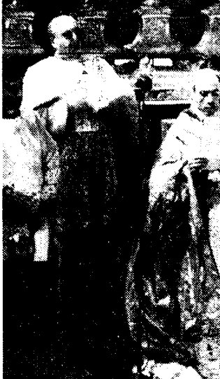
DE EERSTE RADIO-REDE VAN PIUS XII Gezeten op zijn troon voor het altaar der Sixtina en gehuld in vol pontifikaal ornaat, richtte de nieuwe paus Pius XII zijn eerste vredesboodschap zoowel tot de katholieken als de niet-katholieken, tot « alle leden van het groote menselijke gezin ».