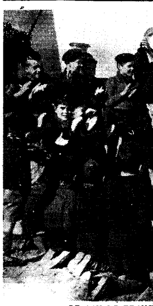
DE AAN DE FRANCO-HEL ONTSNAPTE SPAANSCHE KINDERTJES HERLEVEN IN HET VREDIGE VANDERVELDE-HOME