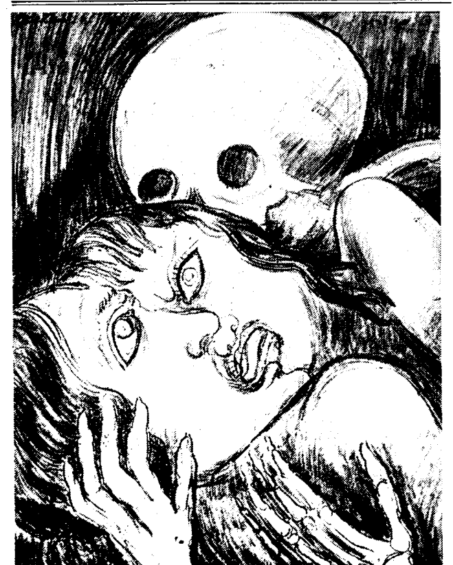
EEN TEEKENING VAN JACOB EPSTEIN

Het scenisch apparaat bij een Indiëse voorstelling was eenvoudig: er bestonden geen speciale theaters, geen dekors, geen machinerieën, zodat hier de fantasie van den toeschouwer moest aanvullen. In de paleizen was een bijzonder hal of koncertaal; de opvoering gebeurde tegen een gordijn als achtergrond, waarachter zich de kleedkamer bevond: van hieruit treden de spelers op. Uit de verslagen van de Hollandsche kranten blijkt onder tusschen, dat Johan de Meester dezen ouden Indiësch stijl niet heeft willen nabootsen, maar uit zijn dichterlijke fantasie een eigen vorm heeft opgebouwd. Er zijn inderdaad dekors, die de illusie wekken van een Indiësch paleis; maar met kleine wijzigingen voor allerlei bestemmingen: de woning van een brahma'n, de gerechtshoof, een hoozen toren, een park moeten dienen, en altijd teeder onwezenlijk en toch aan den anderen kant zeer suggestief schijnen te zijn.