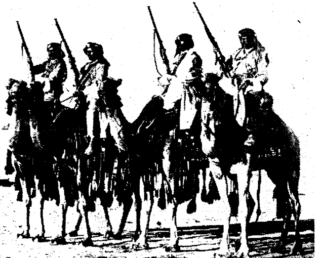
OP VERKENNINGSTOCHT IN HET WOESTIJNLAND VAN IRAK Het zijn afdeelingen Maristen die het politietoelicht uitoefenen in de woestijnstreken van Irak, langzaam de kostbare petroleum-pipelines hun weg naar de zee vinden