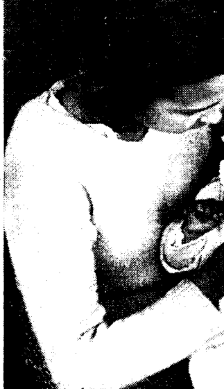
DE JONGSTE SPAANSCH SPRUIT DIE IN BELGIE VERZORGD WORDT

Naar Unied Press verneemt, heeft Barrio van-dag nog aan Negrin gezegd, dat hij tijdens zijn verblijf in Frankrijk onmogelijk zijn officiële funkties kan uitoefenen, omdat Frankrijk de regeering van Franco erkend heeft. Niettemin blijft hij steeds bereid, alles in het werk te stellen om zoo snel mogelijk het sluiten van den vrede te vergemakkelijken.