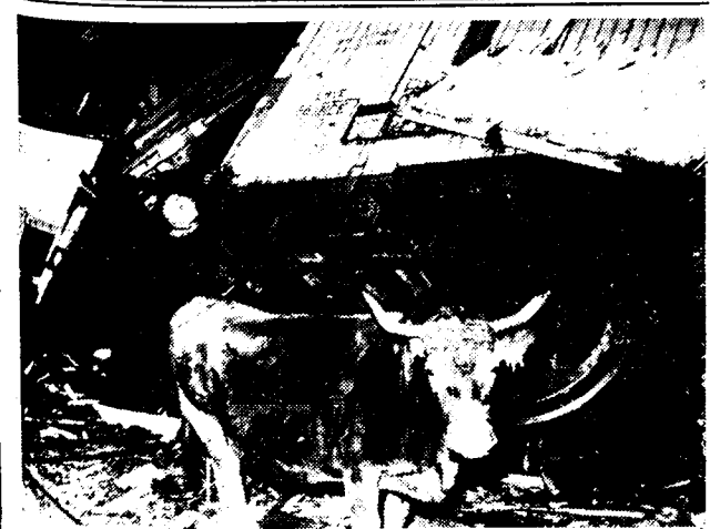
DE ONTSETTENDE SPOORWEGRAMPT BIJ CHATEAUX (FRANKRIJK) Een kijk op de plaats van de ramp. Een koe komt even kijken naar het tragisch spektakel door een os van haar kudde gemoniteerd

Op de lijn Eggersdorf-Tropau zijn 2 treinen op elkander gebots. 21 personen liepen hierbij min of meer ernstige verwondingen op.