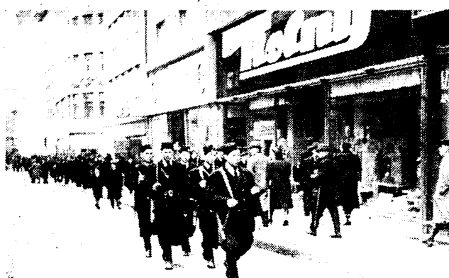
Hlinka-wachten patrouilleren in de straten van Bratislava, de hoofdstad van het « onafhankelijke » Slowakije