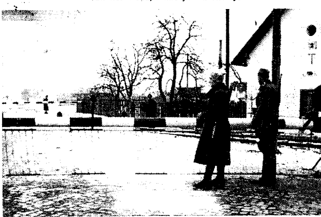
Opname van een grenspost tusschen de Hongaarsche en Subkarpatische gebieden in de omgeving van Munkacs. Zoals men elders lezen kan zijn Hongaarsche troepen Subkarpatisch Oekraïne binnengetrokken