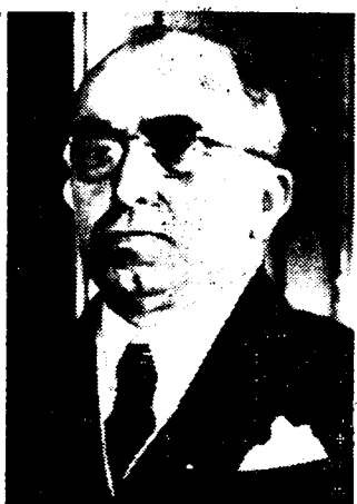
HACHA voorzitter (of liever gewezen voorzitter) van de Tsjecho-Slowaaksche republiek zaliger

Het Tsjechische volk onder de "bescherming" van het Duitsche Rijk Praag door de Duitsche troepen bezet