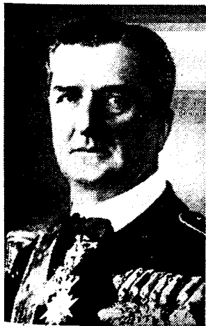
ADMIRAAL HORTHY de Hongaarsche regent.