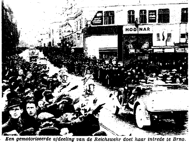
Een gemotoriseerde afdeling van de Reichswehr doet haar intrede te Brno.