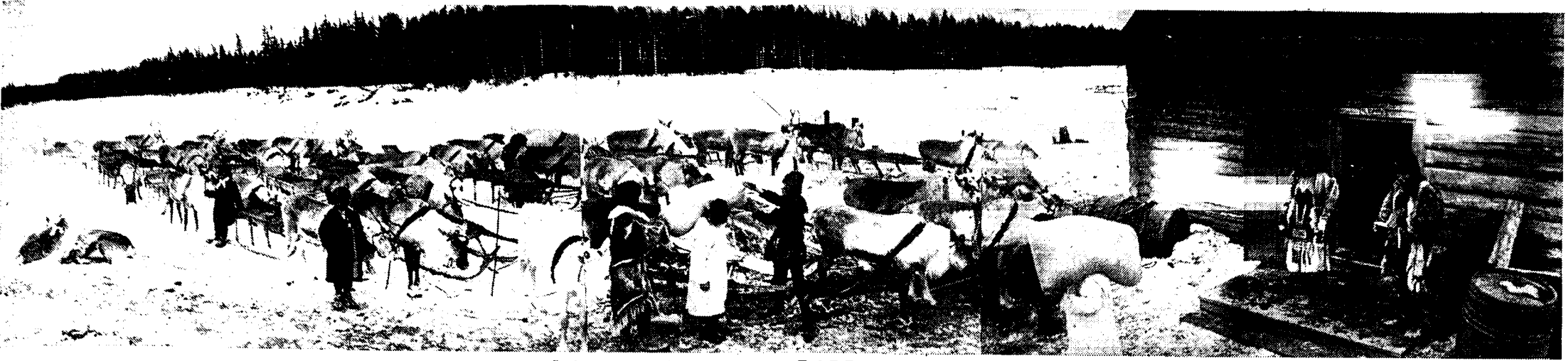
HET LEVEN IN HET BARRE NOORDEN

Een merkwaardig tooneeltje uit het leven van de bewoners van Noordelijk Siberië: pelsjagers zijn hun waren op een faktorij komen verkopen en laden hun rendierspannen met levensmiddelen die zij er zich hebben aangeschaft.