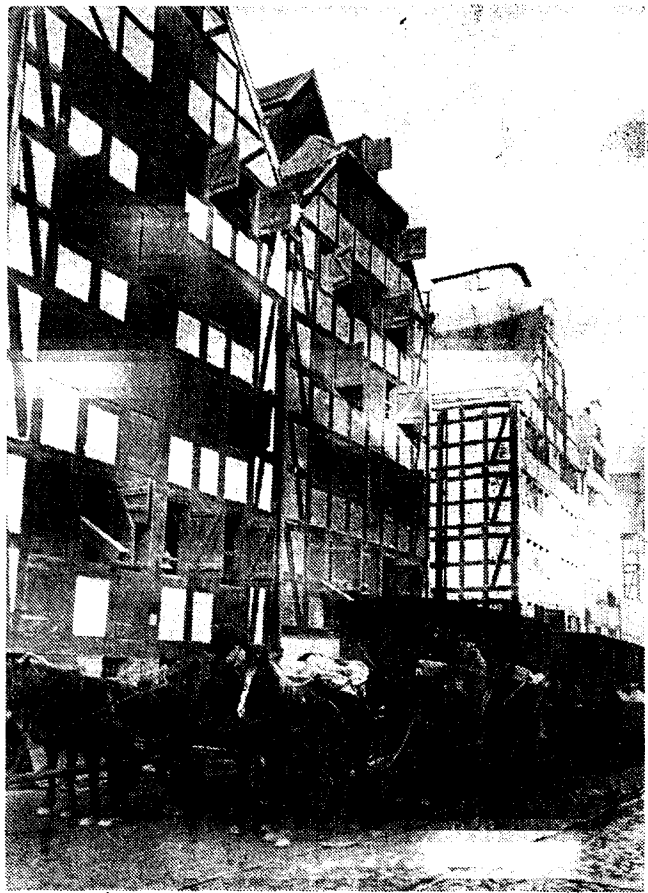
BIJ DEN NAZI-DRUK OP DE BALTISCHE LANDEN Een kiekje van oude stapelhuizen in de Dantiger havenwijk.