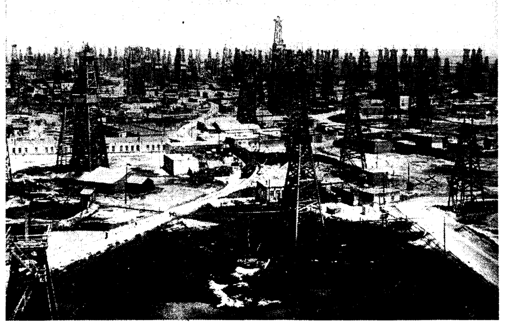
Een zicht van de Russische petroleumstad Bakoe, aan de Zwarte Zee, de werkelijke inzet van den Duitschen drang naar het Oosten, waarbij Roemenië het gevaar dreigt onder de voeten te worden getoopen.