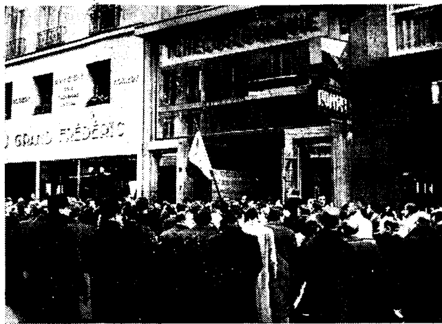
EEN PRO-TSJECHISCHE MANIFESTATIE TE PARIJS Door Fransche en Tsjecho-Slowaaksche oudstrijders, werd voor het Tsjecho-Slowaaksche Toerisme-office een betooging van sympathie voor het getroffen volk gehouden.

DE FRANSCH EN ENGELSCH PROTESTNOTA'S BRUTAAL TE BERLIJN AFGEWEZEN