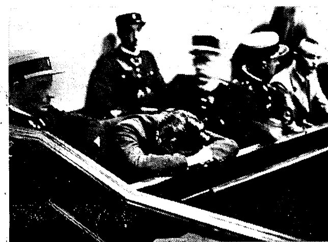
DE INEENSTORTING VAN EEN MOORDENAARSGEMOED Weidmann, na zijn gewezen maat Million (rechts in de beschuldigungsbank) formeel beticht te hebben van den moord op Leblond, barst in snikken los en verbergt zijn gelaat achter zijn armen.

Die laatste voorwaarde is vereischt, om te voorkomen, dat de voorstanders van de afzighedspolitiek een selmatige campagne van verzet tegen de regeeringspolitiek zouden inrichten. (Zie vervolg blz. 3)