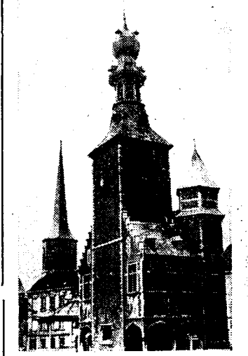
NATUUR- EN STEDENSCHON Het belfort van Tielt, dat a 1775 is op zijn beurt, door de kommissie voor natuur- en stedenschoon als historisch monument geklasseerd