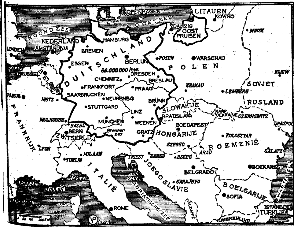
Europa met zijn «wandelende» grenzen

WAARBIJ POLEN, ROEMENIE EN DE BALKANLANDEN ZOULDEN AANSLUITEN tegen de Duitsche veroveringspolitiek