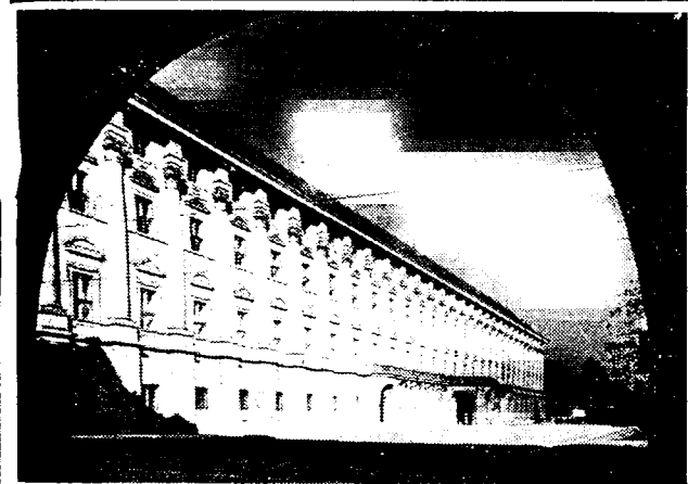
Een zicht op het ministerie van Binnenlandse Zaken te Praag.

Al wat wij hierboven hebben geschreven is geweten of wordt ten minste toch gevoeld in onze Vlaamsche steden. Wij vreezen nochtans dat zulks niet het geval is op onze Vlaamschen buiten, waar de katholieken dikwijls het spel van het V.N.V. spelen. Gedurende de twee weken welke ons nog scheiden van den 2n April, zouden wij moeten het middel vinden om de waarheid te doen kennen tot in de kleinste woning onzer Vlaamsche dorpen.