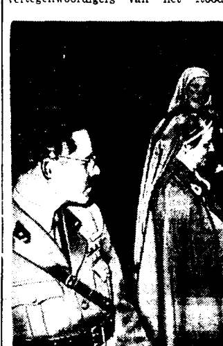
De verpleegsters van het Rode Kruis te Gent geven aan elk een tandborstel en een tube Colgate Tandpasta.

De militaire overheid en het Rode Kruis, zetten de propaganda voor betere tand- en mondhygiëne voort. In de grootsche propaganda door de militaire overheid met medewerking van het Belgische Rode Kruis, om de fabriekanten van de bekende Colgate-tandpasta, die geheel en al voldoet aan de vereisten die men stellen kan aan een volkomen hygienisch product, is een lofwaaige poging om den jongen soldaat de gewoone van mond- en tandverzorging eigen te maken. Deze opvoedende strekking is zeer belangrijk met het oog op de algemene gezondheidstoestand van het volk en wij kunnen de vruchtbare samenwerking van leger, Rode Kruis en privaats initiatief niet genoeg steunen en aanmoedigen.