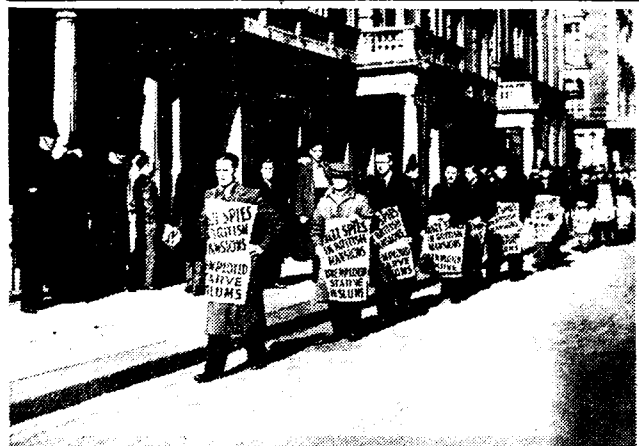
ANTI-NAZI-BETOOGINGEN TE LONDEN Te Londen hadden groote betoogingen plaats tegen de heimelijke nazi- bedrijvigheid op Engelschen bodem

Als men ons voor Vlaanderen naar onzen indruk vraagt, antwoorden wij : Het gaat goed. Wij zijn optimist.