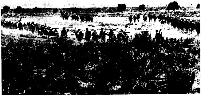
Nationalistische troepen rukken op naar Madrid