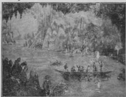
Grottes de Han: le Lac d'Embarquement

Les Grottes de Han sont les plus vastes et les plus grandioses du Monde: plus de 200.000 touristes les visitent chaque année.