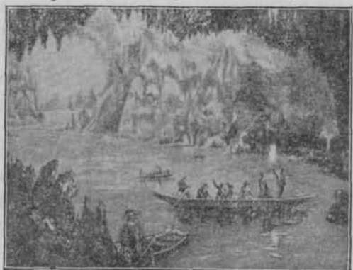
Grottes de Han: le Lac d'Embarquement

Les Grottes de Han sont les plus vastes et les plus grandioses du Monde: plus de 200.000 touristes les visitent chaque année.