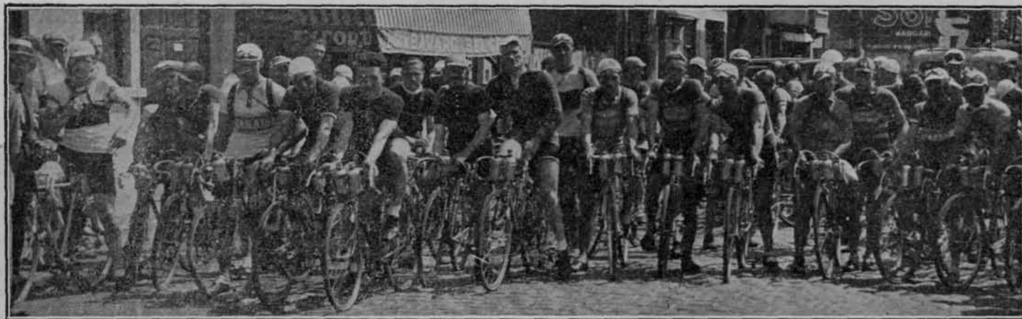
Les coureurs au départ du Tour de Belgique rouge 1937. Plusieurs d'entr'eux seront sélectionnés pour l'Olympiade. De renners aan het vertrek van de Roode Ronde van België 1937. — Meerdere onder hen zullen geselecteerd worden voor de Olympiade.

De zifting die we doen, moet uiterst zorgvuldig