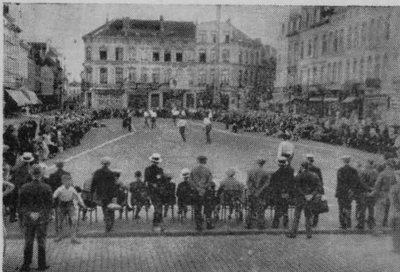
Nos joueurs de balle pelote disputent leur finale en 1936 Onze kaatsbalspelers in 1936 bij de finaal van hun kampioenschap

Quelques semaines nous séparent encore de l'ouverture de la III me Olympiade Ouvrière. Partout les préparatifs avancent fiévreusement, prennent l'allure d'une veille de grand événement de réjouissances longuement attendues et ardemment désirées. On en parle dans les assemblées, à l'atelier, dans les cafés, autour des ballodromes. La III me Olympiade forme le centre de gravité des préoccupations les plus sérieuses de la jeunesse sportive ouvrière.